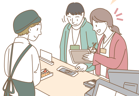
外出同行支援実習の場面